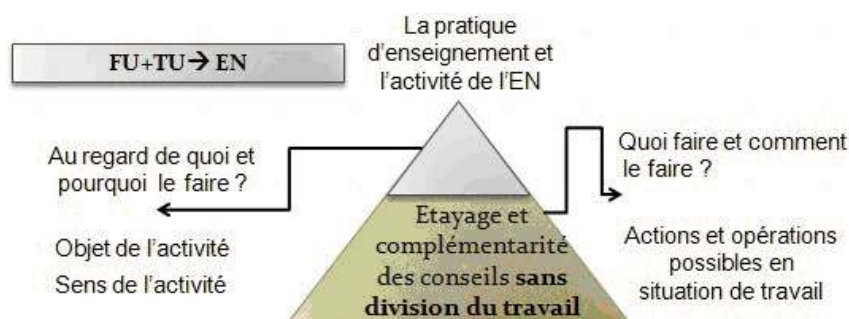
Figure 2 : Complémentarité de l'étayage et des conseils du TU et du FU adressés à l'EN.

pas à préconiser une répartition figée du travail de formation entre les formateurs (Beck & Kosnik, 2000 ; Paris & Gespass, 2001). En effet, lorsque le FU s'est autorisé à suggérer des pistes, cet étayage a révélé à l'EN l'existence d'autres actions possibles que celles ancrées sur l'empan expérientiel mobilisé par le TU pendant l'entretien.